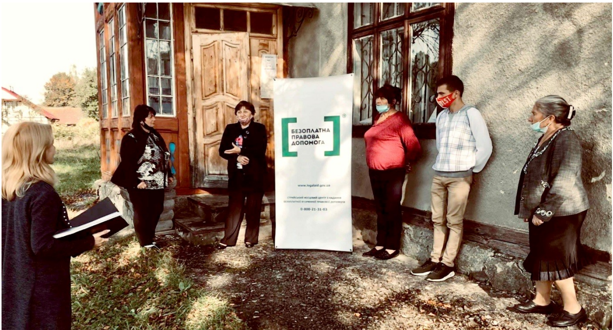
Фахівці Стрийського МЦ під час виїзду в с. Старий Кропивник, Львівщина

Окрім того, через дію в окремих регіонах карантинних обмежень працівниками центрів було забезпечено надання 295 особам безоплатної первинної правової допомоги в рамках проведення онлайн консультувань за допомогою дистанційних форм комунікації (скайп, zoom, телефонний зв'язок тощо).