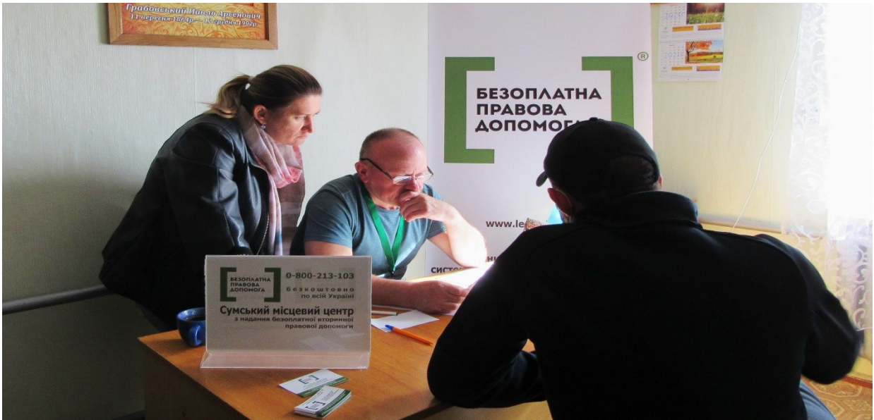
Правове консультування про оформлення договору оренди земельного паю під час мобільного виїзду до с. Гравовське. Краснопільський район, Сумщина

У переліку актуальних правових питань – встановлення та погодження меж земельної ділянки, право користування та усунення перешкод користування ділянкою, приватизація землі, присвоєння кадастрового номера земельної ділянки та зміна цільового призначення ділянки.