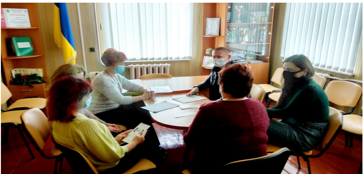
Фахівці Чугуївського МЦ з надання БВПД проводять правопросвітницький захід на тему «Актуальні зміни у земельному законодавстві» для мешканців с. Кам'яна Яруга та співробітників Кам'яноярузької сільської ради, Харківщина.

При наданні правових консультацій значна увага приділяється їхній якості. Для проведення оцінювання якості наданих консультацій відібрані юристи, які пройшли відповідне навчання.