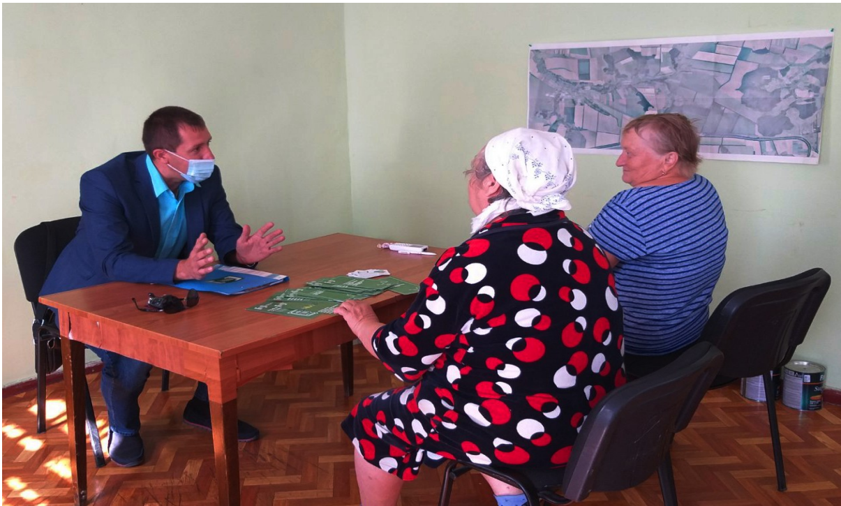
Виїзне консультування з питань земельних правовідносин в Крисинській сільській раді. Богодухівський район, Харківщина