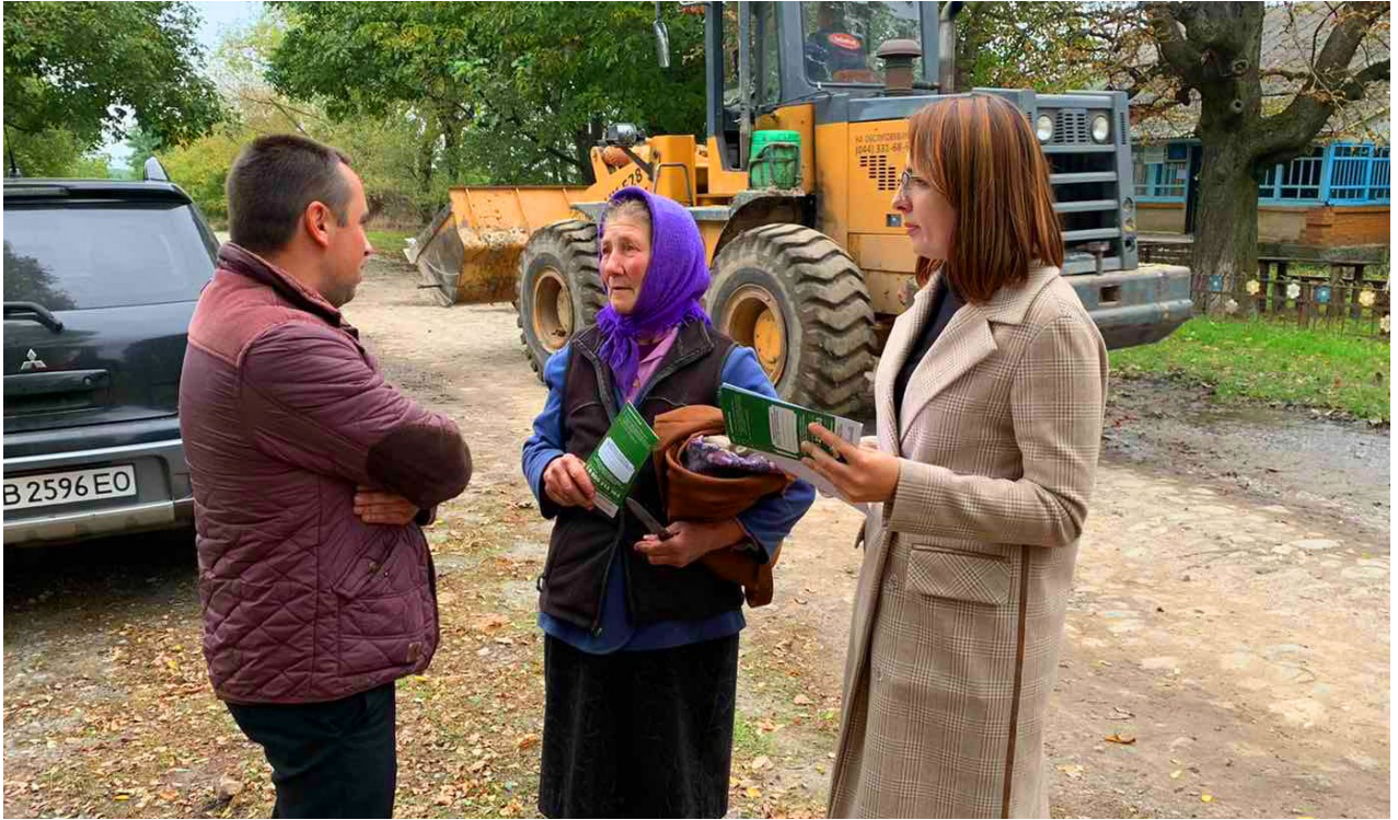
Фахівці системи БПД проводять правопросвітницьку роботу. Вінниччина