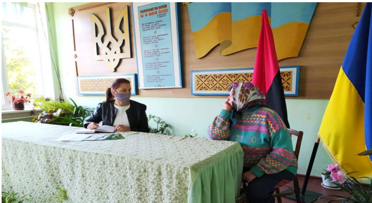
Фахівчиня відділу «Надвірнянське бюро правової допомоги» Івано-Франківського МЦ з надання БВПД консультиє місцеву мешканку з питання оренди паю. С. Перерісель, Івано-Франківщина

Для системи БПД «земельна» тема не нова. Адже у трьох областях – Київській, Львівській та Миколаївській – за підтримки Міжнародного банку реконструкції та розвитку реалізований пілотний проект «Підтримка прозорого управління земельними ресурсами в Україні». Проведені тренінги для працівників системи БПД, адвокатів, юристів органів місцевого самоврядування, об'єднаних територіальних громад, землевпорядників та реєстраторів. Мобільні групи виїжджали для консультування із земельних питань у віддалені громади.